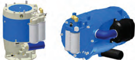
Elementos de compresión

Hay elementos de compresión en formato horizontal superiores a 1,26 m³/min (44,5 cfm) disponibles hasta un máximo de 12,06 m³/min (425,9 cfm). Hay elementos de compresión de formato vertical a partir de 1,41 m³/min (49,8 cfm) disponibles hasta un máximo de 7,33 m³/min (258,9 cfm). Existe disponible un conjunto de enfriador externo que se puede colocar de acuerdo con la especificación del cliente.